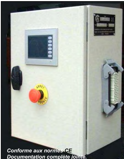
Conforme aux normes CE Documentation complète jointe. Dimensions et présentation NON contractuelles

Applications : Automatisation de toute machine séquentielle à commandes électro – pneumatiques.